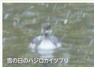
雪の日のハジロカイツプリ

井の頭池が気に入ったらしいハジロカイツプリは、その後も滞在を続けていますが、見かける場所がポート池の開けたエリアに限られるようになりました。そこはカイツプリたちの縄張りの中間地帯なので、あまり追い立てられずに済んだようです。夜も、キンクロハジロに混じってポート池に浮かんでいました。そのハジロカイツプリが11月25日を最後に姿を消しました。その前日の、54年ぶりという11月の降雪が気持ちを交えさせたのかも知れません。 12月10日現在、池にいるカイツプリは3カップル。いずれも仲が良さそうで、鳴き交わしたり、木の枝に巣材を積み上げる共同作業をしたりして、絆を確かめ合っています。縄張り意識が強いので、他のカップルとは争うし、冬越しだけが目的のカイツプリやハジロカイツプリの侵入も許しません。 とはいえ、お茶の池、ポート池、弁天池に1組ずつなら、おおむね平和です。たぶん3組が井の頭池にちようどいい数で