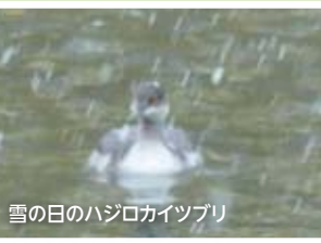
雪の日のハジロカイツプリ

井の頭池が気に入ったらしいハジロカイツプリは、その後も滞在を続けていますが、見かける場所がポート池の開けたエリアに限られるようになりました。そこはカイツプリたちの縄張りの中間地帯なので、あまり追い立てられずに済んだようです。夜も、キンクロハジロに混じってポート池に浮かんでいました。そのハジロカイツプリが11月25日を最後に姿を消しました。その前日の、54年ぶりという11月の降雪が気持ちを交えさせたのかもしれません。 12月10日現在、池にいるカイツプリは3カップル。いずれも仲が良さそうで、鳴き交わしたり、木の枝に巣材を積み上げる共同作業をしたりして、絆を確かめ合っています。縄張り意識が強いので、他のカップルとは争うし、冬越しだけが目的のカイツプリやハジロカイツプリの侵入も許しません。 とはいえ、お茶の水池、ポート池、弁天池に1組ずつなら、おおむね平和です。たぶん3組が井の頭池にちようどいい数で