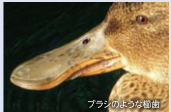
ブラシのような櫛歯

もっとも、私が見た限りでは、近隣の公園の池にもこの冬はハシビロガモが少ないようです。10月末の皇居のお濠には多数いました。カモは飛べるので、より良い場所があればそちらに移動します。広い範囲を調べて比較しないと、ハシビロガモが井の頭池にいない本当の理由は分かりません。