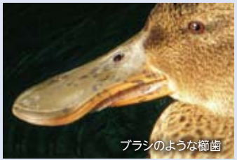
ブラシのような櫛歯

もっとも、私が見た限りでは、近隣の公園の池にもこの冬はハシビロガモが少ないようです。10月末の皇居のお濠には多数いました。カモは飛べるので、より良い場所があればそちらに移動します。広い範囲を調べて比較しないと、ハシビロガモが井の頭池にいない本当の理由は分かりません。